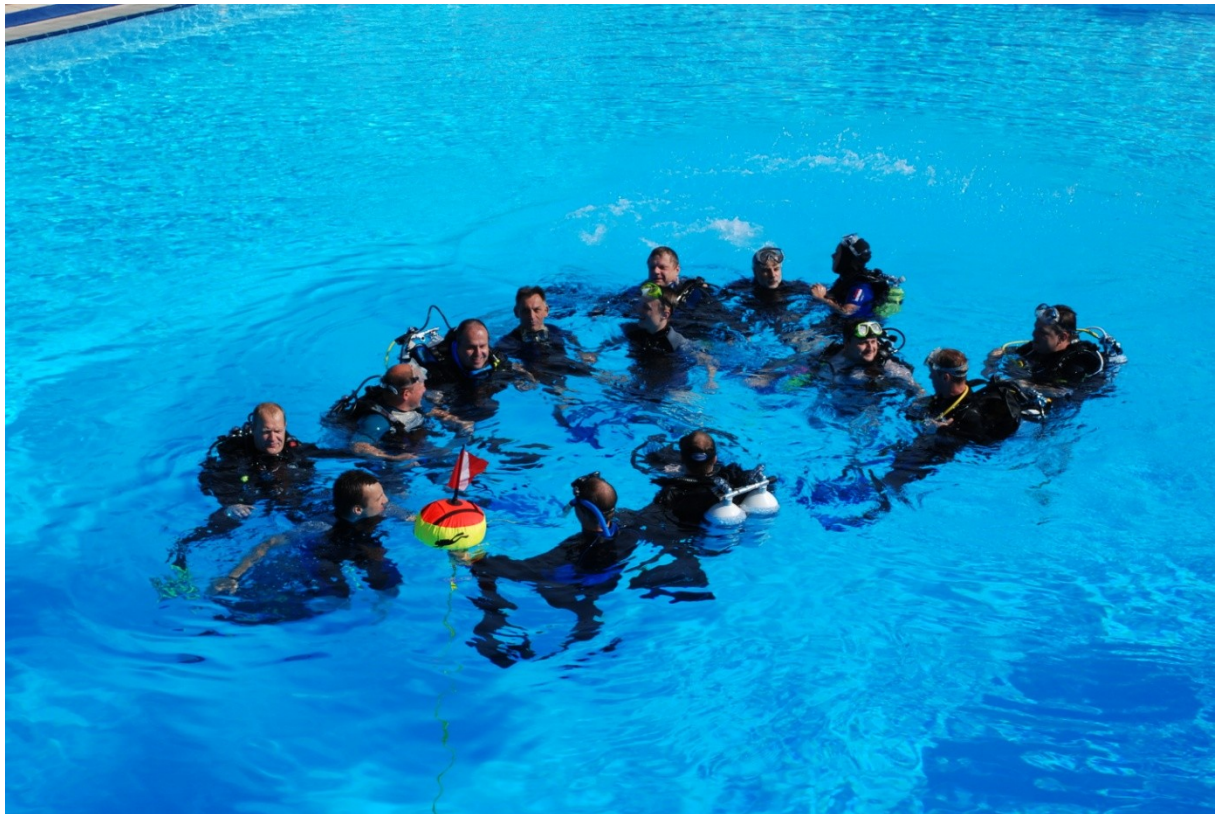
Text: Ulrich Marose